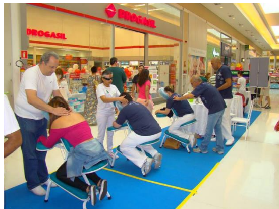
Participação da equipe Serenidade do Toque durante a 16ª Campanha Nacional de Doação de Órgãos e Tecidos em 27 de setembro em Polo Shopping Indaiatuba