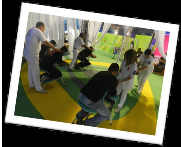
Aplicação de massagem em voluntários do TELETON 2013