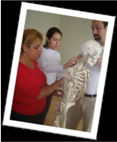
Aula de anatomia